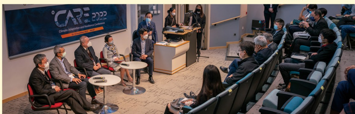
▲ 各持份者於 CARE2022 上就氣候危機相關議題作深入交流。