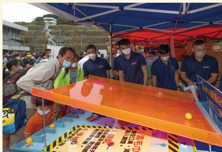
▲ 市民透過參加攤位遊戲學習消防及急救知識。