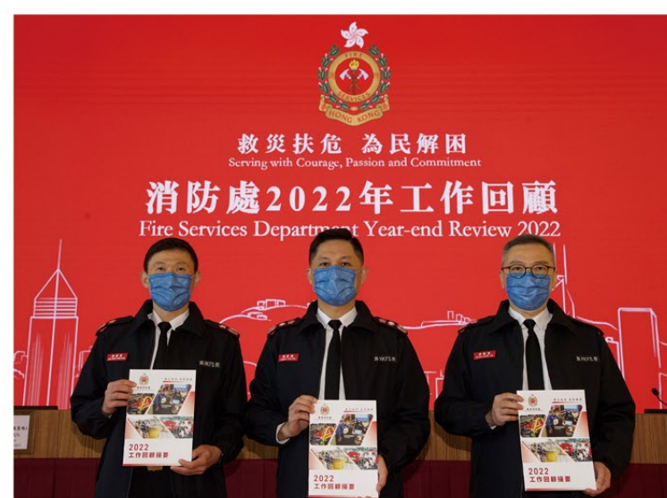
▲ 處長楊恩健（中）、副處長（行動）黃鎮業（右）及副處長（公眾安全及機構策略）陳慶勇（左）出席年終回顧記者會。

本處亦會繼續協助實踐政府建設智慧城市的目標，目前正與本地大學合作，研究利用人工智能配合大數據和地理資訊進行運算，以優化消防安全巡查部署。另外，本處會製作救護車調派模擬器，估算緊急救護服務需求，以優化救護車部署及調派安排。同時亦將建立一個綜合流動應用程式，以協助進行山嶺搜救行動。