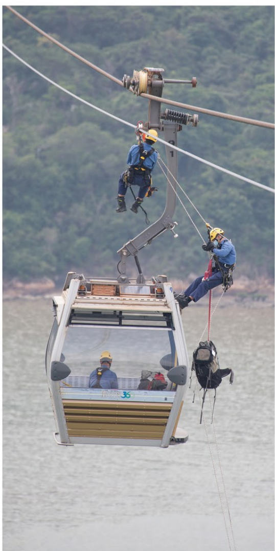
▲ 消防人員模擬從纜塔橫移至纜車頂，進入車廂拯救被困人士。

演習模擬纜車運行時發生機件故障，失去動力，同時有被困車廂內的乘客感到不適。部門的救援人員身穿全套高空拯救裝備，由地面攀爬至60米高的纜塔，在塔頂鋼纜設置安全系統，並在高空頂着強風橫移超過150米至纜車車廂頂進行拯救，確是體能和技術的考驗。