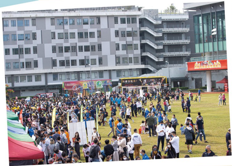
▲ 開放日獲市民踴躍支持，氣氛熱鬧。