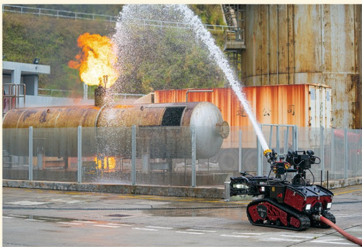
▲ 滅火機械人示範滅火工作。