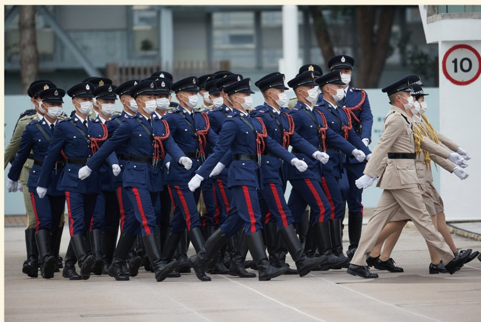
▲ 消防處儀仗隊與其他紀律部隊儀仗隊以中式步操進場。