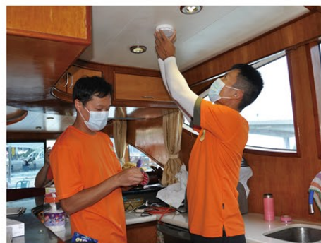
▲ 消防處義工隊隊員為船家安裝獨立火警偵測器。