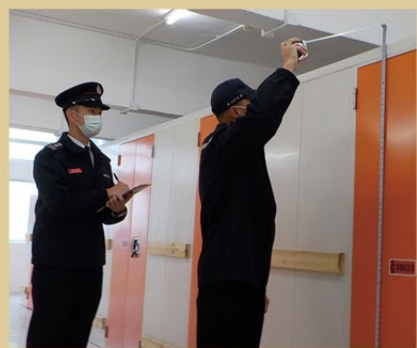
▲ 樓宇改善課同事檢查迷你倉的消防裝置及設備。