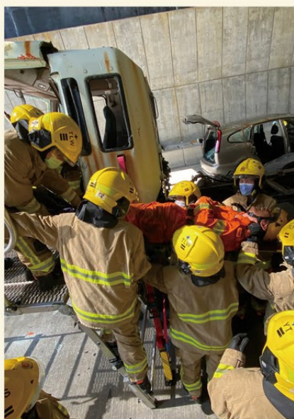
▲ 公路及鐵路拯救專隊隊員進行處理交通意外事故的訓練。