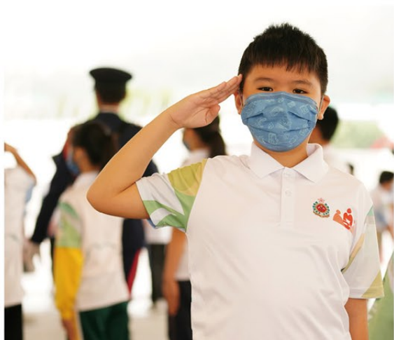
▲ 黃大仙區中、小學生透過「黃大仙區中式步操訓練計劃」學習中式步操。