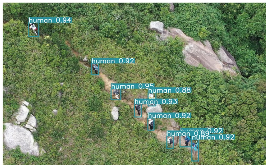
▲ 相片經人工智能軟件分析後，有助救援人員識別人形物體的位置。

利用該軟件協助山嶺搜救，既可大大減省肉眼檢查相片的時間，提升部門處理攀山拯救事故的救援效率，亦可搜索前線人員難以到達的位置，進一步保障同事安全。