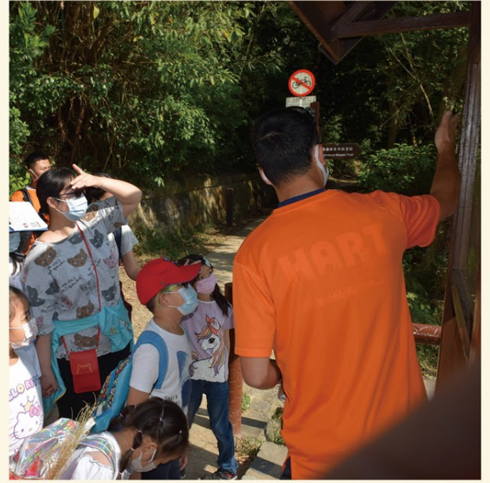
▲ 消防人員向參與活動的家庭介紹安全遠足路線。

我在活動中看見很多親子溫馨時刻，提醒了我每次救援行動所拯救的不只是當事人，更是整個家庭。我也意識到除了提升自己的山嶺拯救技術外，參與不同的推廣活動亦是守護市民的一種方式。