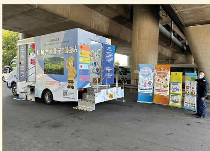
▲「危險品執法宣傳車」於葵涌危險品車輛驗車中心介紹法例的詳情。

另外，危險品執法課引入了「危險品執法宣傳車」，並已於去年十二月中旬投入服務。宣傳車除了作流動辦公室及執法行動指揮室之用，亦會於各地區流動宣傳，旨在提高市民對新修訂法例的認識，以及鼓勵牌照持有人盡快續領符合新法例的牌照。