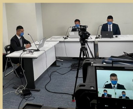
▲ 消防處透過網上講座宣揚樓宇消防安全信息。

此外，樓宇改善課同事亦於十二月十四日到訪觀塘區的工業大廈，與迷你倉業界深入交流，講述倉內潛在的火警危險及相應的改善措施。