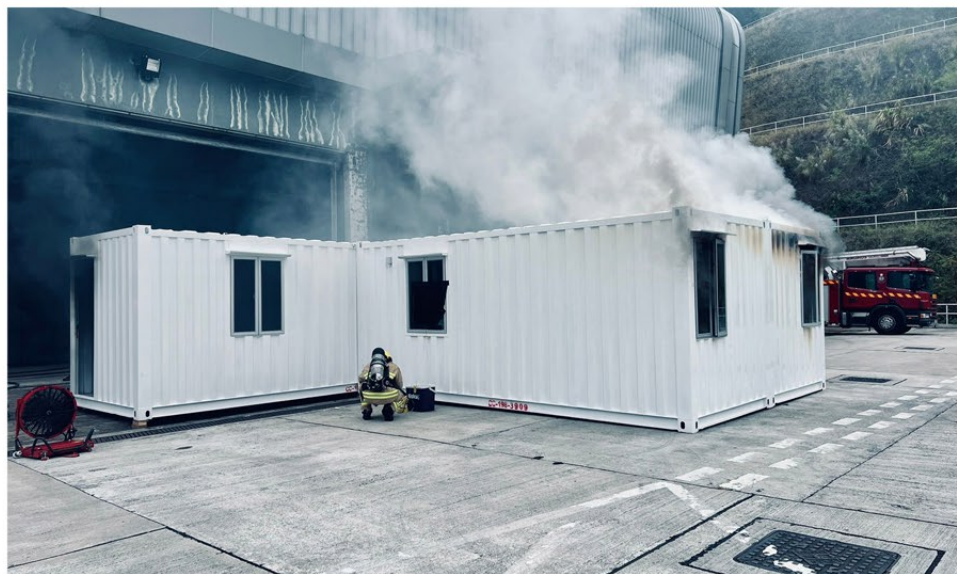
▲ 部門於消防及救護學院搭建一所比例為一比一的安老院舍，進行模擬火警測試。

政策課及室內煙火特性訓練組會繼續合作，透過不同形式的測試、研究及實驗方式，提升各類處所的消防安全水平，並將所得經驗融入訓練，加強實火訓練的質素和加強行動效率。