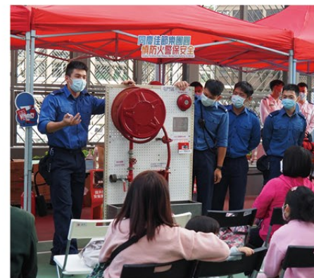
▲ 新界北總區同事到屯門菁田邨向居民宣傳防火知識。