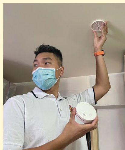
▲ 消防處義工隊隊員為獨居長者安裝獨立火警偵測器。

青衣消防局於十二月八日舉行青衣防火安全日，為居民送上「防火三寶」，包括滅火筒、滅火氈及獨立火警偵測器，向社區傳遞防火知識。休班同事亦於公餘時間加入消防處義工隊，上門協助獨居長者安裝獨立火警偵測器和進行家居防火安全檢查，並向他們分享日常家居用電及煮食的安全意識。