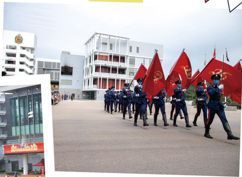
▲ 消防處儀仗隊示範中式步操。