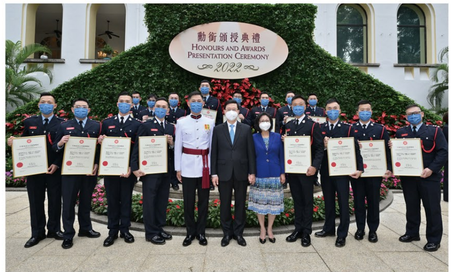
▲ 行政長官李家超 (前排中) 及處長楊恩健 (前排左五) 與一眾獲嘉獎的消防處同事於勳銜頒授典禮上合照。