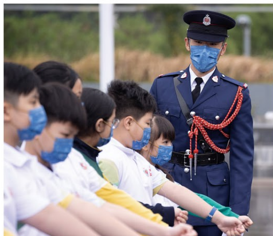
▲ 消防處儀仗隊隊員教授小學生中式步操。