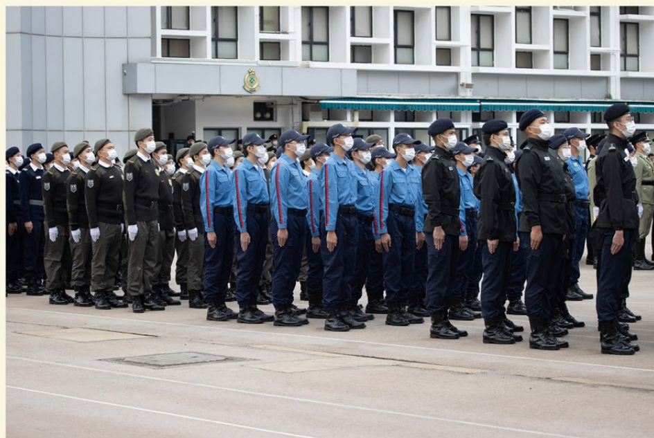
▲ 消防及救護青年團 (藍色上衣者) 聯同其他青少年團隊參與「憲法四十周年升旗儀式」。