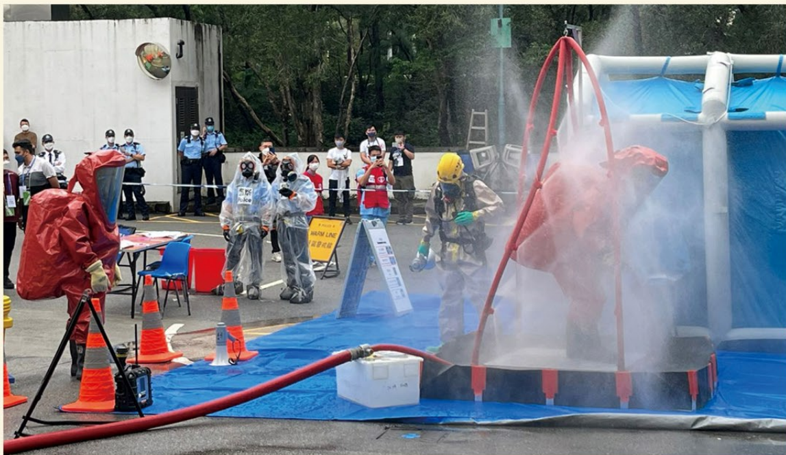
▲ 危害物質專隊到場處理化學品及進行洗消。

部門亦於當日使用無人機拍攝現場實況，於流動指揮車上即時直播，令所有人員能更準確掌握現場情況，靈活調配資源進行救援。