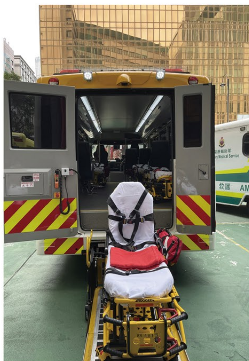
▲ 抬床運送及載客兩用車配置了可供升降抬床的電動尾板。