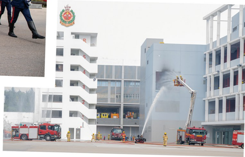
▲ 消防人員示範滅火救援工作。