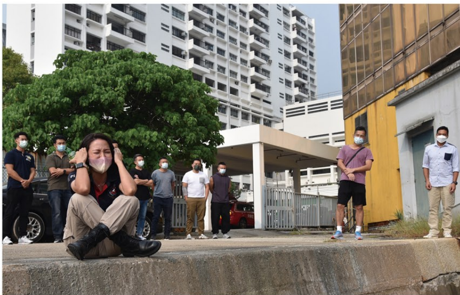
▲ 學員透過處境訓練認識如何處理涉及企圖自殺的個案。