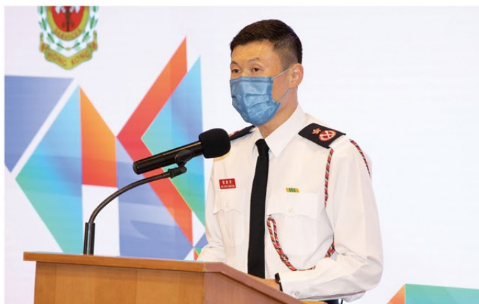
▲ 副處長（公眾安全及機構策略）陳慶勇於2022年冬季防火活動啟動禮上致辭。

活動的啟動禮於尖沙咀消防局舉行，去年新成立的消防處社區聯動網絡成員及各區消防安全大使名譽會長等均應邀出席。啟動禮後，副處長（公眾安全及機構策略）陳慶勇聯同荃灣區的地區聯動網絡委員、消防安全大使名譽會長及地區防火委員到訪荃灣區，向市民派發滅火設備，休班同事則為他們安裝獨立火警偵測器。