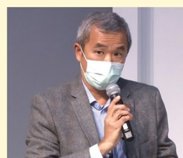
▲ 副消防總長（行動支援及專業發展）吳贊良在 CARE2022 工作坊中作分享。

香港科技大學於去年十二月十日及十二日舉辦「氣候適應及復原力大會」（CARE2022），讓政府及不同界別的持份者就氣候危機相關議題作深入交流。副消防總長（行動支援及專業發展）吳贊良應邀在一個工作坊向與會者簡述消防處如何善用智能科技，提升人員於極端天氣下處理大型事故的行動效率，並減低其工作風險。吳贊良亦於會上分享消防處義工隊如何在災後協助社會復原，以及介紹部門的防災宣傳和教育工作。