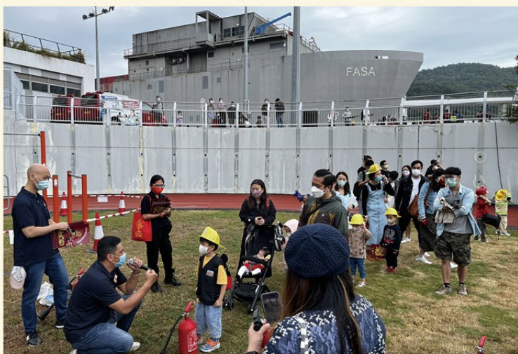
▲ 消防人員向市民講解如何正確使用滅火筒。

開放日獲市民踴躍支持，有逾萬人入場同樂，氣氛熱鬧；而場內秩序井然，流程順暢，實有賴各團隊合作無間，體現團隊精神。