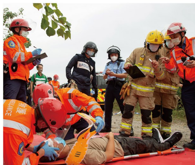
◀ 消防及救護人員在演習中分秒必爭救治傷者。