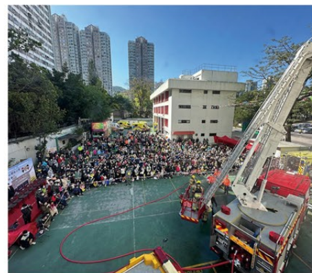
▲ 粉嶺消防局及救護站舉辦開放日，場面熱鬧。

新界北總區同事到訪屯門和元朗多個地點，向居民宣傳家居防火知識及推廣使用獨立火警偵測器。另外，同事亦於十二月十八日在粉嶺消防局及救護站舉辦開放日暨北區防火安全活動日，活動設有攤位遊戲及滅火救援示範，吸引大批市民參與，氣氛熱鬧。