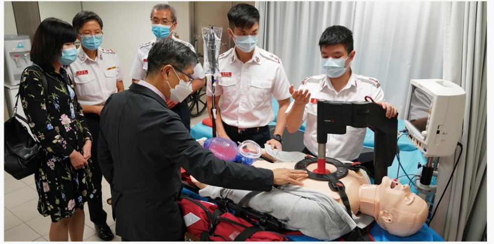
▲ 學員展示救護設備及示範治理程序。

12位完成首屆課程的救護主任已取得輔助醫療教官資格，並即將實踐所學，培訓更多優秀的輔助醫療人員。