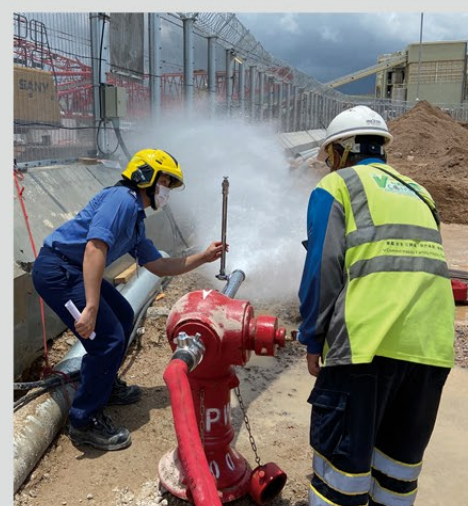
▲ 機場擴建工程課人員驗收機場輔助設施的消防栓。

未來，機場擴建工程課將繼續與各個部門及單位合作，致力協助達成「機場城市」這發展願景，鞏固香港國際機場的國際航空樞紐地位，緊貼粵港澳大灣區發展。