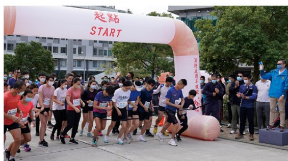
▲ 參加親子組競跑的同事及其子女起步開跑。

消防處體育福利會舉辦的「消防處周年競跑」於去年十二月三日在消防及救護學院順利舉行，當天有超過500名健兒參加比賽。經過一番激烈競爭，最後由九龍總區勇奪總區隊際賽冠軍。部門亦首度增設親子組競跑，除了讓團員與子女一同挑戰自己外，亦讓子女更了解父母在消防處的工作環境及體能上的鍛鍊。