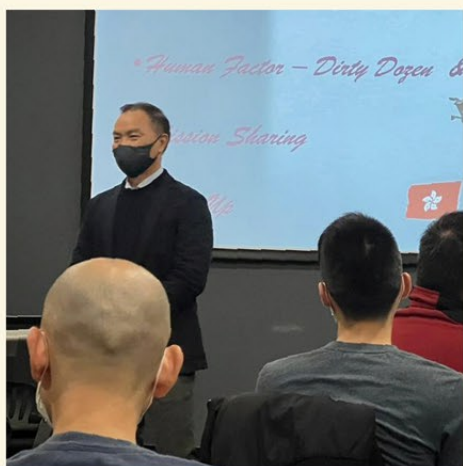
▲ 政府飛行服務隊總監胡偉雄機長向同事分享工作點滴和領導心得。

三位嘉賓向同事分享他們如何憑着對工作的使命感、無懼的精神、專業的知識和經驗帶領團隊跨越各種挑戰，完成每個「不可能的任務」。同事亦從中領悟到「僕人式領導」的理念和好處，並立志成為願意聆聽、甘於服務、具同理心、懂得尊重和勇於承擔的「僕人領袖」。