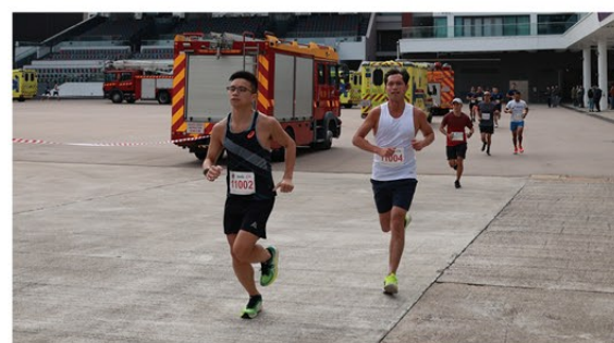
▲ 消防處周年競跑於消防及救護學院內進行。