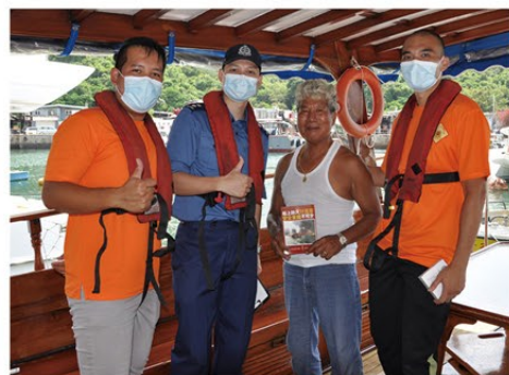
▲ 港島總區同事向香港仔避風塘內的漁船和遊艇宣揚防火信息。

此外，消防處義工隊亦與東區民政事務處走進社區，為東區三無大廈的住戶安裝獨立火警偵測器，就單位內的防火事宜提供意見，並藉此機會宣傳「應急三識」等消防安全信息。