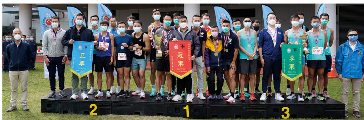
▲ 九龍總區奪得消防處周年競跑總區隊際賽冠軍。